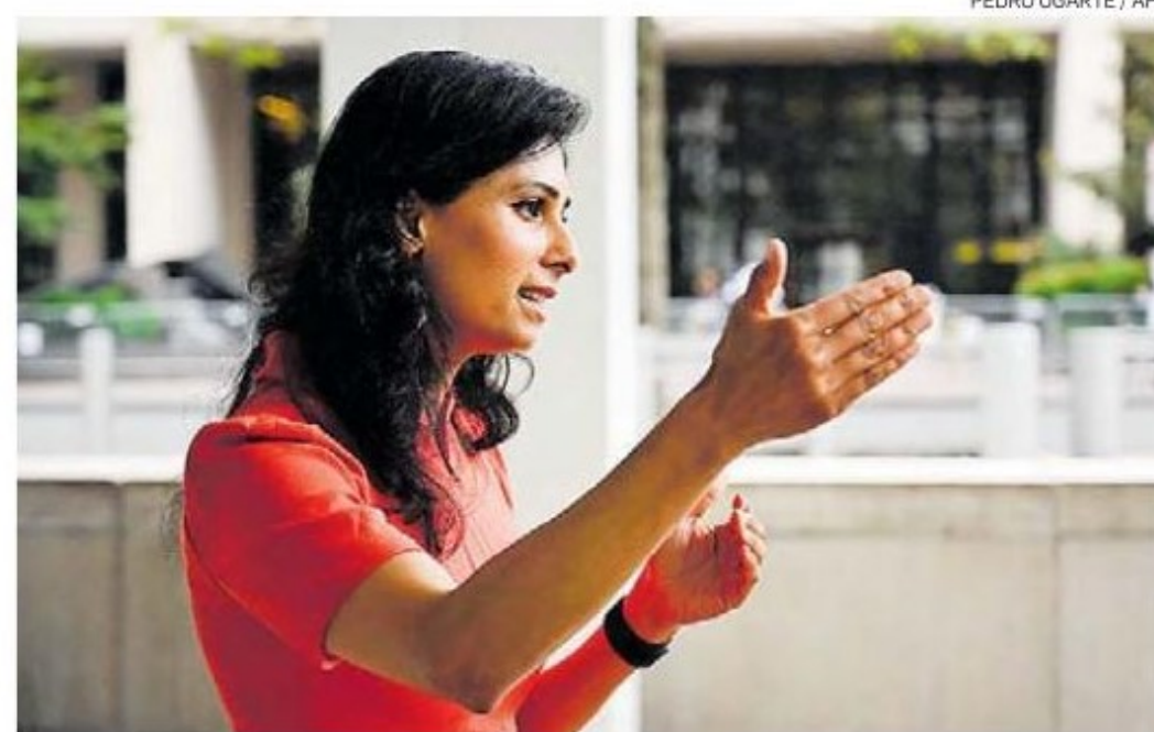
Economista-chefe. Pandemia ainda preocupa, diz Gopinath

reção ao centro da meta no final de 2022". O fundo citou que as ações do Banco Central "mudaram para uma postura menos acomodaticia desde o final de 2020", o que também ocorreu no Chile, no México e na Rússia.