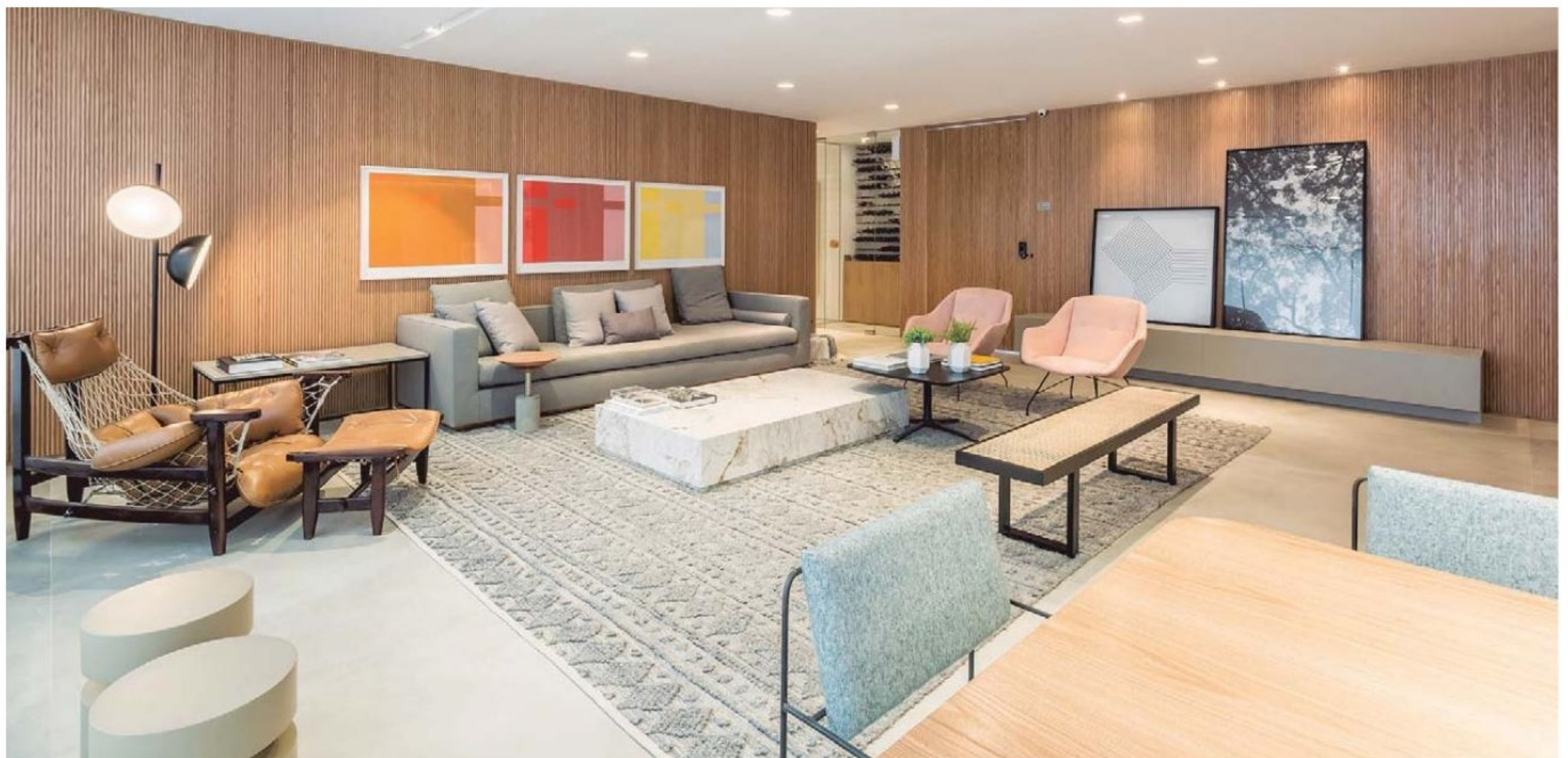
APARTAMENTO DECORADO DE 178M 2