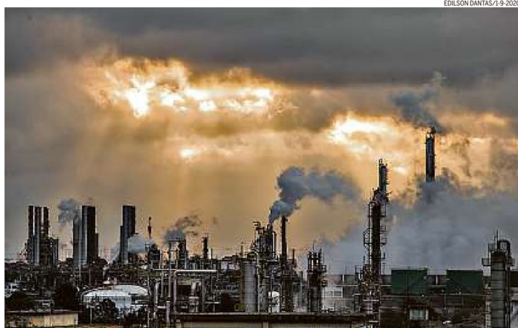
Mais forte. Setor petroquímico de Mauá, em SP: atividade econômica reage, mas 3ª onda de Covid pode inibir crescimento

Mesmo assim, os serviços, os mais afetados pelo fechamento das atividades para combater a pandemia, estão patinando. Seu ritmo está inferior a fevereiro de 2020, depois da queda de 4% em março. Mas já foi constatada recuperação do setor em abril, segundo o Itaú Unibanco, que aumentou sua expectativa para economia este ano de 3,8% para 4%.