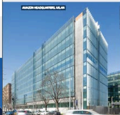
EASTMAN Película de PVB Saflex® Acústico

Ao redor do mundo, quando arquitetos e projetistas têm em mente desempenho e segurança, despoem-se como referência a marca de películas Saflex® para embelezamento arquitetônico. Sabendo disso, a norte-americana Eastman ampliou seu portfólio com o Saflex® Acústico, que permite compor vidros laminados com propriedades acústicas melhoradas em comparação aos laminados feitos com polivinil butiral (PVB) padrão - e reduz o ruído percebido em até 90%. Obtido a partir de múltiplas camadas e construído, o Saflex® Acústico proporciona os benefícios de um PVB acústico com o processamento semelhante aos dos produtos incolores da série Saflex®, como menor tempo de manuseio na laminação. O desempenho varia conforme a laminação e ou instalação. É compatível com as películas Saflex® de PVB incolores e coloridas e apresenta a mesma vida útil do Saflex® Incolor.