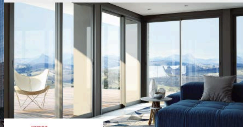
HYDRO Produtiva 25

A linha Produtiva 25, um sistema para portas e janelas de alumínio de médio e alto padrão, combina três características indispensáveis para uma boa esquadria: estética, desempenho e produtividade. Com o número de perfis e o peso otimizados, design contemporâneo (já menos alumínio aparente), rigor na fabricação e na montagem, além de excelente desempenho quanto a estanqueidade, suas portas e janelas revelam-se as mais competitivas do segmento. Visando a otimização do trabalho do fabricante de esquadrias, a linha Produtiva 25 inclui componentes exclusivos e prevê usinagens em menos etapas. Destaca-se ainda por ser a única que oferece tipologias cobijas e encaixilhados, obtidos com os mesmos moldes e componentes, e apresentar o melhor desempenho acústico do segmento.