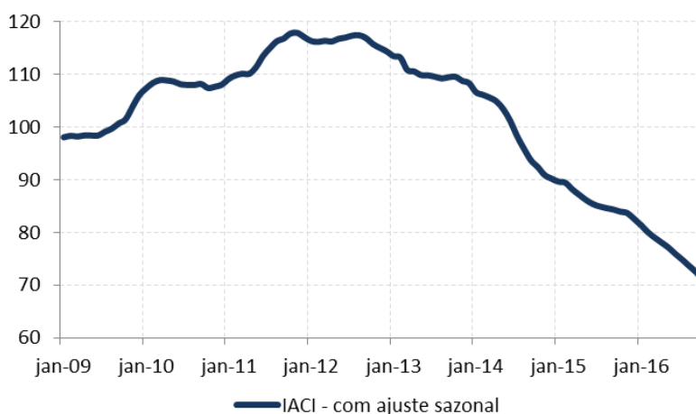
Figura 1: Índice de Atividade da Construção Imobiliária (IACI), com ajuste sazonal (média 2009=100)

A metragem quadrada em construção, medida pelo IACI, apresentou forte retração de 2,0% em outubro ante setembro, quando o índice registrou queda de 1,6% ante mês anterior. Na comparação com outubro de 2015, o índice registra recuo de 15,4%. Com o resultado, a atividade de construção imobiliária acumula queda de 11,0% na média em 12 meses.